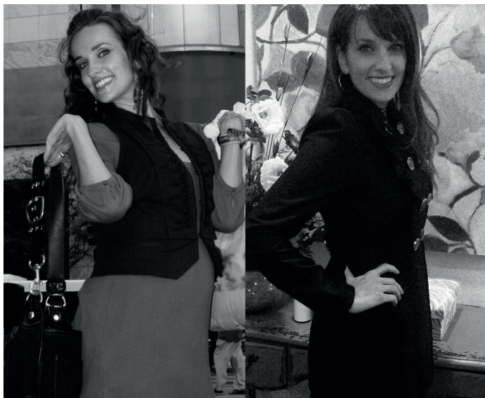
SA WALA PA

naglibog. Nawala ang 13 ka libra ug 9 ka piye (inches) sa iyang hawak sa usa ka gabii samtang siya natulog. Ang iyang likod nga nabaliko ug natuis karon hingpit na nga normal usab. Siya dihadiha nga naayo!