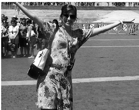
KATIKA SAFARI YA UMISHENI YA ALBANIA-ITALY

iliniambia singeweza kuhusika. Lilikuwa jambo la aibu na la kuchosha kihisia. Ningewezaje kuwafundisha wengine kuhusu upendo wakati mimi sikuweza kujipenda?