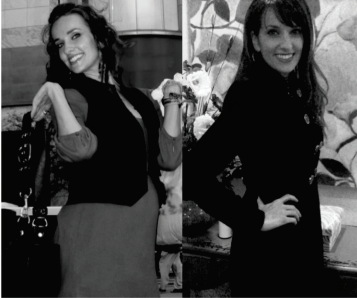
SÁÁJÚ KÍ Ó TÓ

Léyìn òsẹ̀ mejì, ó lọ sórí ìbùsùn rẹ̀, kò si tí sí nkankan ti ó farahàn ni àgọ̀ ara rẹ̀ pé ara rẹ̀ ti yá, sugbọ̀n nigbàti o jí ni òwúrọ̀ ọ̀jọ̀ keji sí ìyàlẹ̀nu, Ó ti dín kù ni ìwọ̀n pọ̀n mètálà àti injisì męsan (éé pọ̀n àti ó injisì) lati ègbé rẹ̀ ki ilẹ̀ tó mọ̀ òun nà pèlù sì sùn lẹ̀. Èyìn rẹ̀ ti o ti bà ti ọ̀ dà bi pé wọn ta ni kòkò ti nàró padà si pò bó ti yẹ̀. Lẹ̀şẹ̀keşẹ̀ ni o ti gbà ìwosàn rẹ̀!